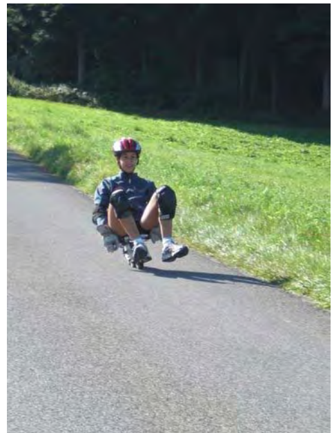
Bim Rico u bir Mire gseht das absolut perfekt us.