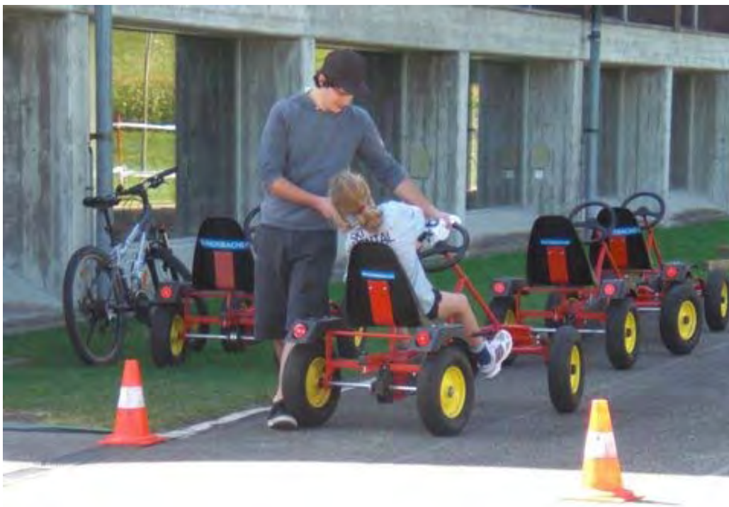
Guet Gödu bisch im Zil acho.