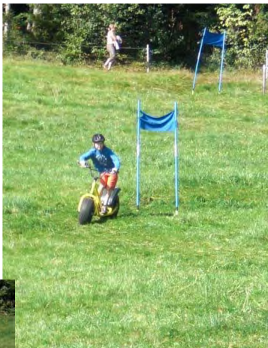
Äbefaus dr Tim