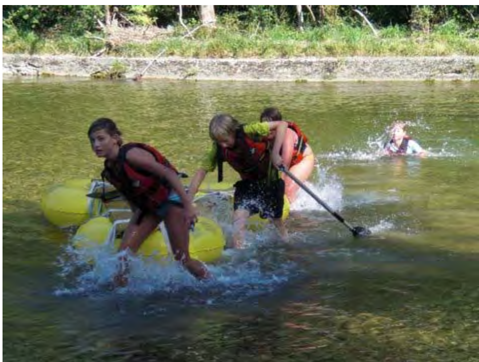
Ds Team ski emmental 1 Isch bereits am usecho.