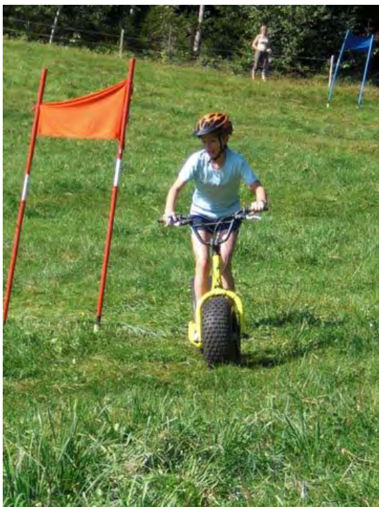
D Ole het aues unter Kontrolle

Nach dem Bockerl ging unsere Reise weiter. Oben an einem Waldrand standen grosse Trotinets bereit. „ Monster Bike “ stand auf dem Programm. Da galt es im oberen Teil der Strecke mit viel Tempo ein Waldstück zu befahren, welches technisch noch keine grosse Herausforderung war. Doch dann kam unser Terrain. Es wurde steil und wir sahen Tore, wie bei einem Riesenslalom. Dieser RS hatte es aber in sich. Unser Lücü nahm das mit dem RS zu wörtlich und schaffte das Kunststück mit dem Monster Bike einen „Einfädler“ zu fabrizieren.