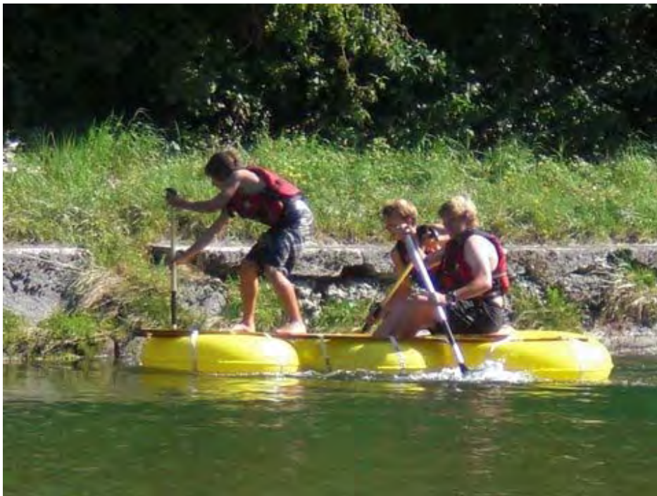
das isch üses Team ski emmental 3 Apo Frits bir Flussfahrt

Nach diesen beiden Adrenalin-Disziplinen mussten wir nun mit den Bikes an die Emme fahren. Auf dem Programm stand „ Tubing “. Das verhiess nichts Gutes. Die Emme ist doch nicht mehr so warm, schoss es uns durch den Kopf. Als wir beim Posten eintraffen wurden uns auch schon Schwimmwesten übergeben. Jedes Team fasste ein Floss und Padel. Zuerst musste das Floss hinauf zum Start getragen werden. Spätestens am Start merkte jeder dass die Emme wirklich nicht mehr speziell warm war. Das Ziel war so schnell wie möglich zwei Bojen zu passieren. Im Ziel mussten wir noch das Floss ans Ufer ziehen und erst dann wurde die Zeit gestoppt.