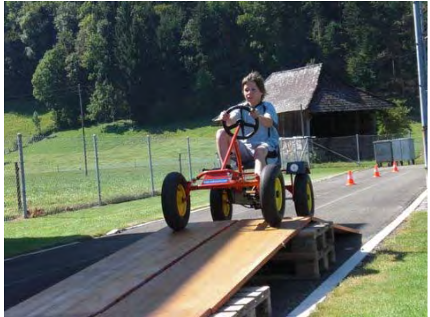
Dr Svenu git vou gas, u dr Jänu isch grad ufeme heikle Hindernis