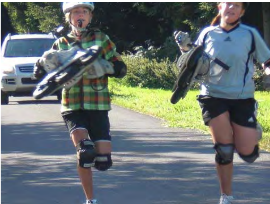
Hingäge üser Lea`s hei z Gfüeu gha mit seckle geits besser...super isatz